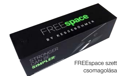
FREEspace szett csomagolása