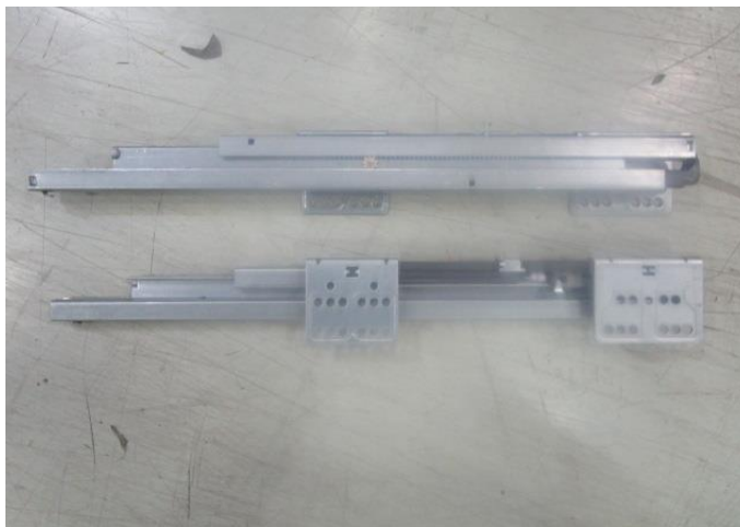
Pic. 1: Overview - unextended