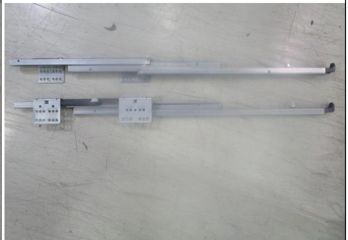
Pic. 2: Overview - extended