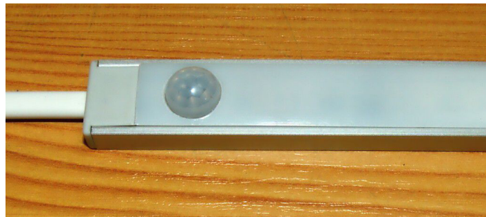
Obr.3 - Ukázka instalace v profilu MICRO